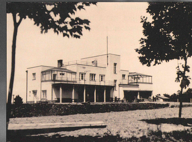
Původně téměř otevřený prostor v okolí veslařského areálu