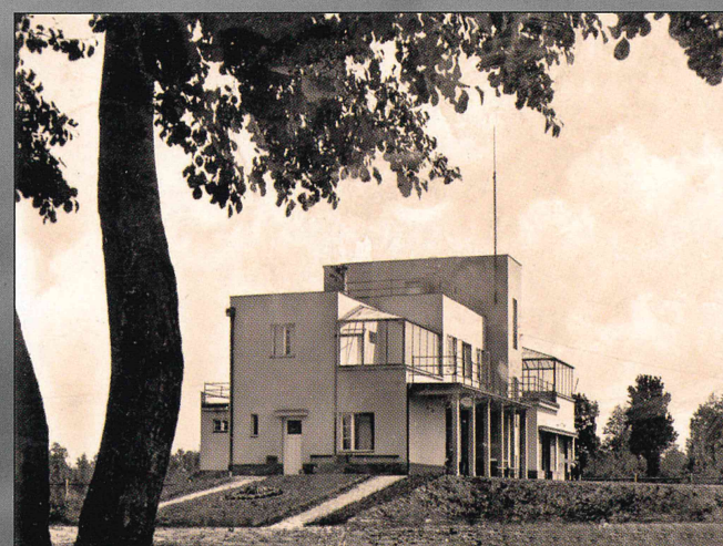
Díky vzrostlé vegetaci dnes už takto budovy spatřit nelze