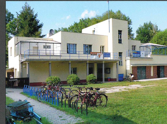
Dnes je okolí klubu skryto v zeleni