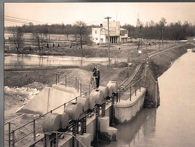
V době regulace Moravy, snad 1933–1935